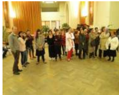
« Tant d'échanges », Débat mouvant, théâtre forum,...autant de façons d'aborder le thème de l'alimentation.