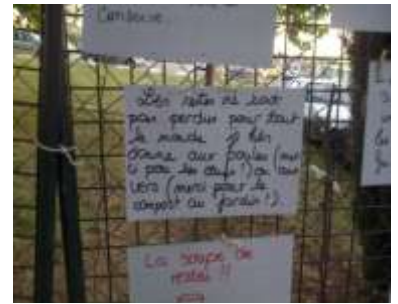
Dispositif « Porteur de paroles » (recueil d'énoncés sur un thème), Ici, sur le gaspillage alimentaire.