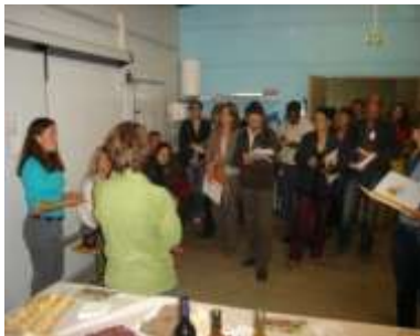
Parcours de visites découvertes d'expériences dans le cadre de l'Université d'été du développement local